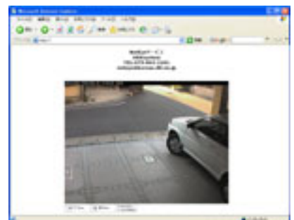
実際のライブ画面

フレッツISDN・ADSL B フレッツ等対応です 1回線にカメラは何台でも設置できます 既存のインターネット回線でも利用可能です。